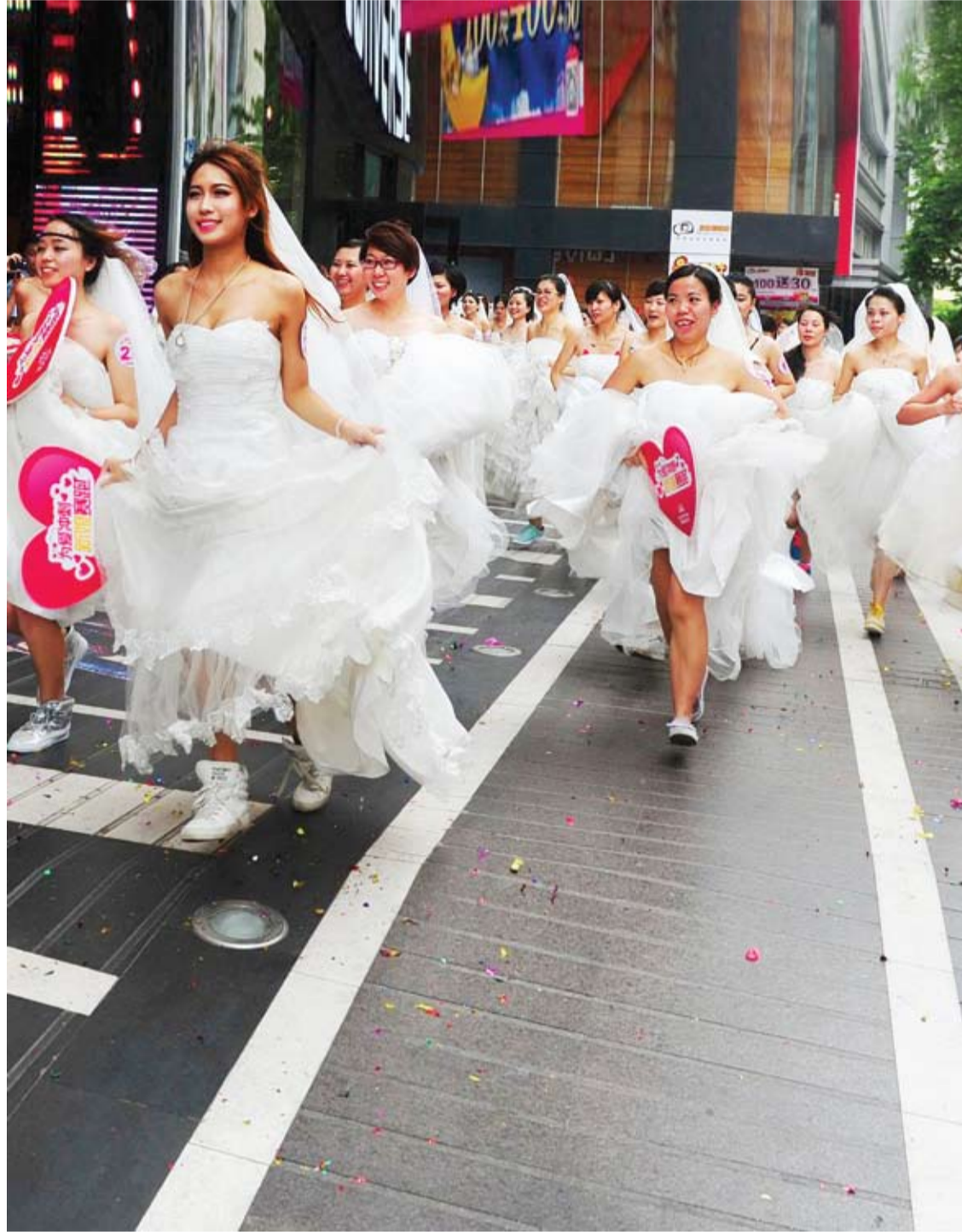
مجموعة من العرائس تشاركن في سباق للعرائس نظمه مركز تجاري للاحتفال بمهرجان تشيشي الذي يصادف اليوم السابع من الشهر السابع في التقويم القمري الصيني.. هو النسخة الصينية من عيد الحب.

كشفت دراسة علمية حديثة أجريت مؤخراً على فاعلية نخالة الارز التي تعمل على الحد من فرص الإصابة بالسرطان والحماية منه. وكانت الأبحاث الطبية قد أجراها فريق من الباحثين الهنود بالتعاون مع مركز أبحاث السرطان التابع لجامعة كولورادو الأمريكية لدراسة مدى فاعلية نخالة الأرز في علاج سرطان القولون حيث تتوافر نخالة الأرز في كثير من البلدان التي تزرع الأرز خاصة في دول جنوب شرق آسيا في الوقت الذي تعد فيه مصدراً غنياً بفيتامين ب. واستطاع الباحثون من خلال أبحاثهم أيضاً بواسطة تكنولوجيا متطورة استخراج الزيت من نخالة الأرز، إلا أنه ليس له استخدام واسع بسبب عدم وجود التوعية الكافية والمناسبة لفوائده بين الكثيرين أيضاً للمنافسة الشديدة الناجمة عن محاربة شركات إنتاج الزيت من الزعفران لهذ الزيت الصحي المهم. وأظهرت الأبحاث احتواء هذا الزيت على خواص طبيعية وهامة تعمل على مكافحة السرطان والوقاية منه.